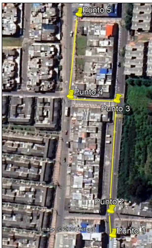
Ilustración 1. Recorrido verificación ambiental

Se realizó recorrido de control y vigilancia en el cuadrante 1, barrio RENACER el día 24 de junio del 2024, desde las coordenadas 4°42'34,956"N- 74°12'6,198"W hasta las coordenadas 4°42'29,418"N- 74°12'2,25"W (ver ilustración 1. Ruta amarilla), con el fin de verificar las condiciones ambientales, identificar posibles afectaciones a los recursos naturales y realizar las acciones de prevención correspondientes.